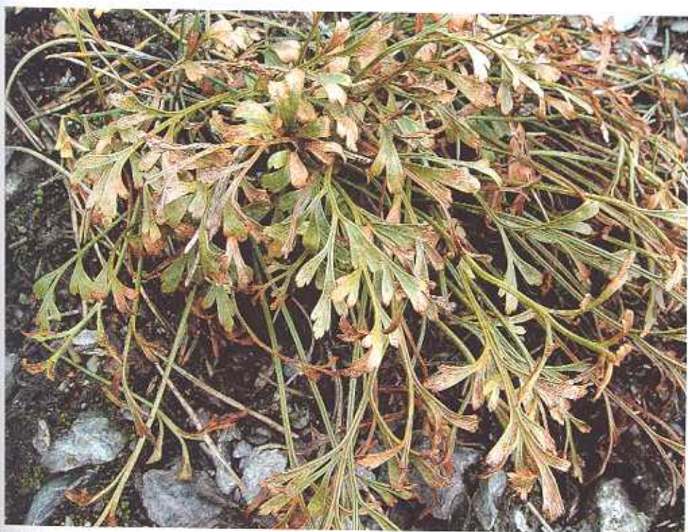
Abb. 1: Asplenium × wojaense im Locus classicus

Bayreuth, eine Ausnahmegenehmigung zur Befreiung von den Verboten der Verordnung über das NSG „Wojaleite“, Pflanzenteile zu entnehmen und die Wege zu verlassen, beantragt. Dem Antrag wurde stattgegeben.