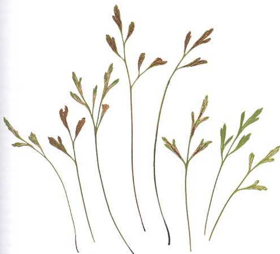
Herbarium S. Jeßen – SJ-3707

Asplenium × wojaense S. JESSEN (= Asplenium cuneifolium × A. septentrionale )